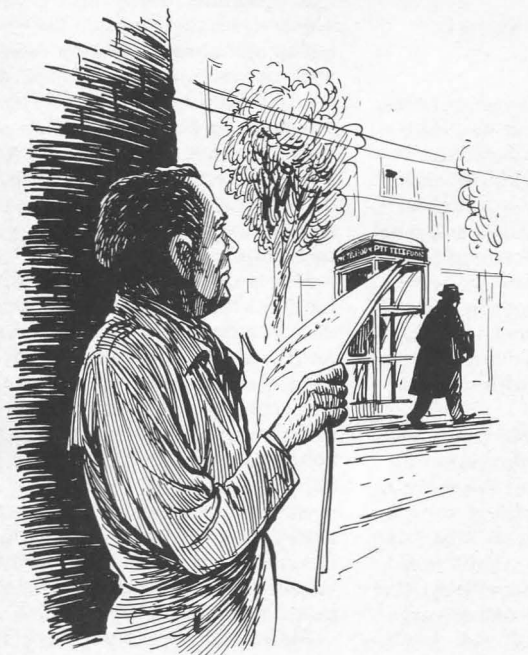
Het inwinnen van gegevens over personen

Onder de inlichtingentaak verstaat het Koninklijk Besluit: 'het inwinnen van gegevens over organisaties, groeperingen en personen waarover het vermoeden bestaat, dat deze een gevaar vormen voor het voortbestaan van de democratische rechtsorde, of