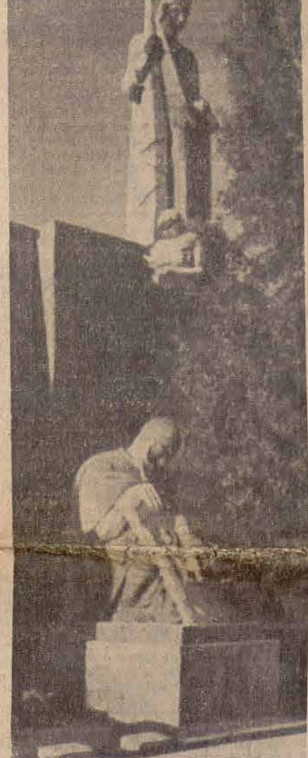
Glūži kā sarkanbaltarkanals karogs simbolizē mūsu valsts brīvību un neatkarību un pavada mūs trimdas ceļos, tā sērōjās mātē Latvijā un ievalnotā karavīra tēls Brālū kapos ir latviešu tautas cīņu un upuru apliecinājāji, pie kuriem šodien atmiņā atgriežas neskaitāmi tūkstoti latviešu visā pasaulē

14. jūnija naktī Padomju savienības valdība, kas melīgi sludina vārdos brīvību visām tautām, okupētajā Latvijā brīvvalsti, apmeļot un ignorējot ne tikai brīvību un taisnību, bet arī cilvēcību, bez jebkāda iemesla izrāva no saviem klusajiem mākokļiem 14.693 latviešu, krievu, židu, poļu un citus Latvijas tautai piederīgos locekļus un kā lopus iekrāva (poļševiku terminoloģija) preta vagonos bez visnepieciešamākām sanitārām ierīcēm, tālā ceļā zvēriski mocīja viņus ar slāpēm un badu, pa ceļam mirušos izmetot kā kritušus kustoņus no vagonēm ceļa malā.