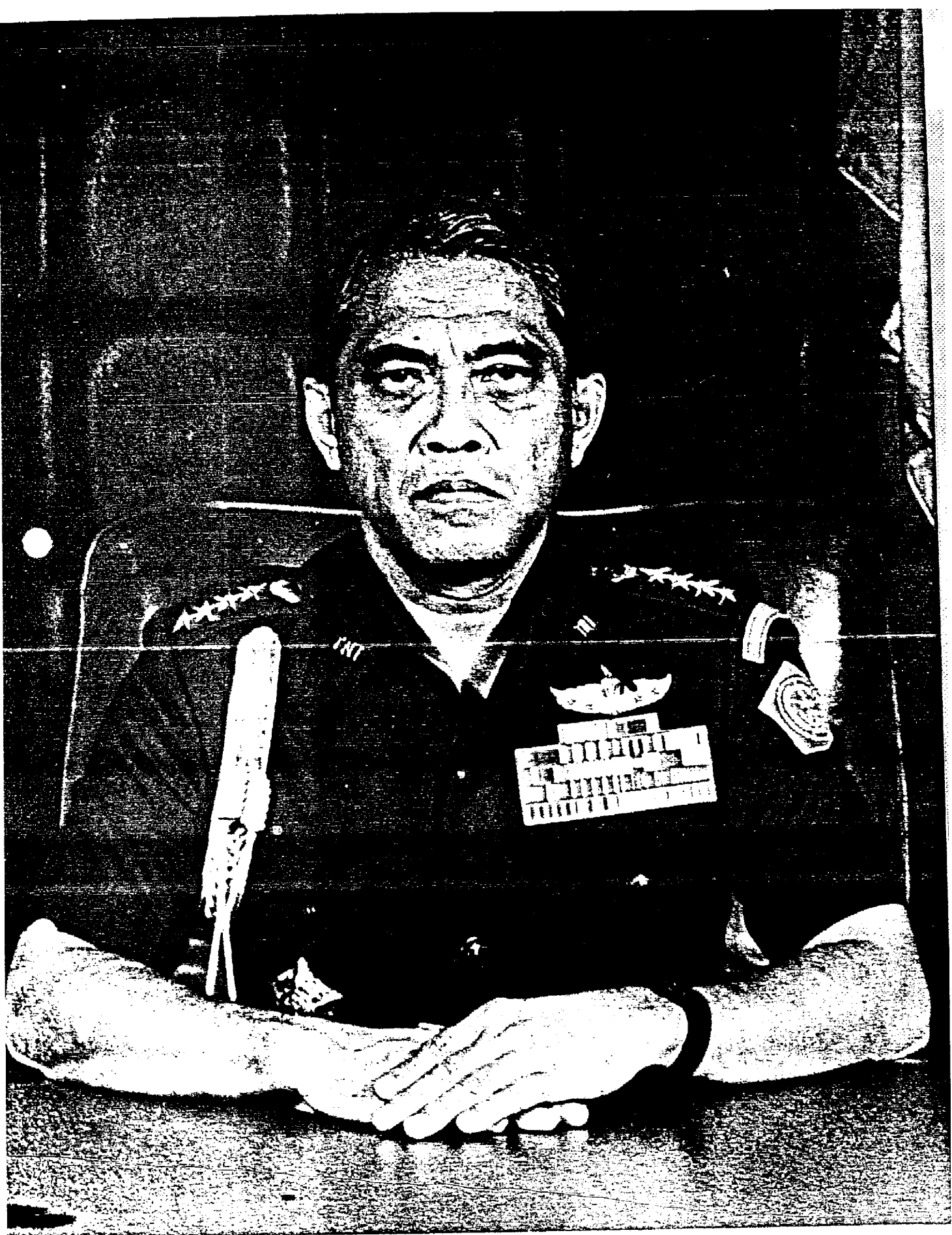
PANGLIMA ANGKATAN BERSENJATA JENDERAL TNI L.B. MURDANI