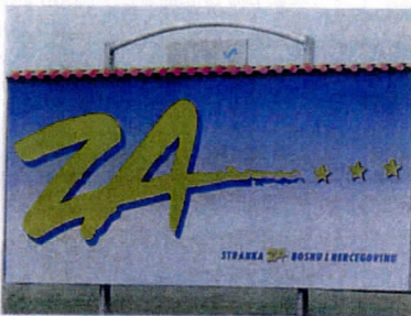
Verkiezingsplakkaat van SBIH

(Stranka za Bosnu i Hercegovinu, Partij voor Bosnie-Herzegovina) De SBIH heeft zich tijdens de vorige verkiezingen van november 2000 sterk geprofileerd als een partij die staat voor de afschaffing van de entiteiten. Haar toenmalige verkiezingsleus "BiH bez entiteta" (Bosnië zonder entiteiten) spreekt wat dat betreft voor zich.