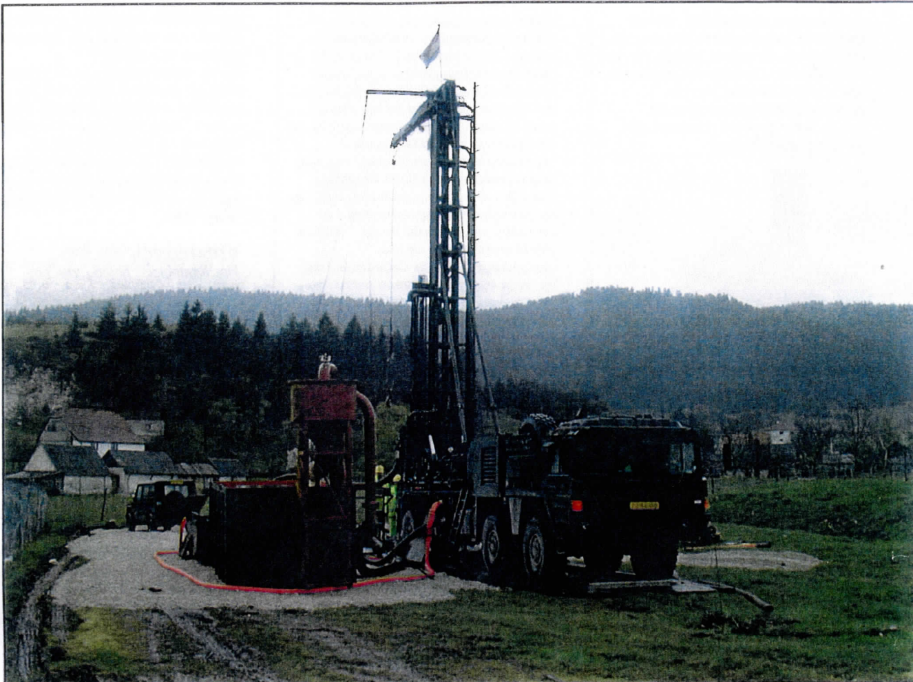
Waterboren in Bosnie

Minden (Duitsland) om een 3 weken durende opleiding te doen op de oude installatie van de Duitsers. Aansluitend werd voor twee man van het project-team en een onderhoudsman bij de firma die de installatie leverde samen met Duitsers een onderhoudscursus van 3 weken gegeven. Na ook dit tot een goed einde te hebben gebracht werden de twee adjudanten boormeesters twee maanden te werk gesteld bij Nederlandse boorbedrijven om boor ervaring op te doen. In juni 99 werd er voor de boormeesters en de bedienaars die ook van 101 NBC pel afkwamen een bedienaars opleiding in elkaar gezet om samen met de Duitsers te leren hoe men zo'n installatie moet bedienen. Van augustus 1999 tot maart 2000 heeft de (toen als bekend de) boorgroep op verschillende oefenterreinen in Duitsland met verschillende geologische ondergrond proefboringen gedaan om zo de installatie en de problemen van de bediening onder controle te krijgen. Omdat wij nog niet geautoriseerd waren was het moeilijk om materieel technisch de zaak voor elkaar te maken. Dit heeft het boordetachment er niet van weerhouden om de schouders er onder te zetten en hebben zo inmiddels 7 operationele boringen op zitten in binnen en buitenland. Doordat de order portefeuille inmiddels goed gevuld is en de nieuwe