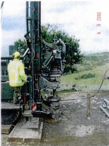
Close-up van boorgat

proefboringen noodzakelijk zijn om precies het grondwater te traceren. Na vijf dagen boren was de einddiepte van 116 m bereikt. De auteur dezes heeft direct na het bereiken van de einddiepte de steenmonsters die iedere meter door het boorteam zijn genomen geanalyseerd.