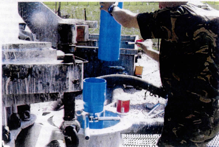
Plaatsing van een filter