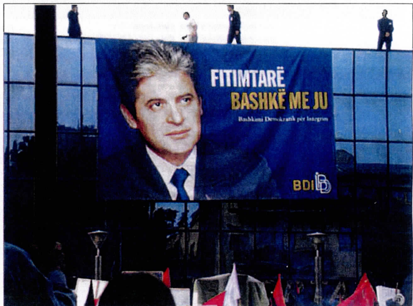
Wimpel van de DUI

Tenslotte de regering. Die staat voor de uitdaging om de deplorabele economische toestand op te lossen, en de hoge werkeloosheid terug te brengen. Alleen met internationale steun zal het verscheurde land weer uitzicht krijgen op herstel van de hope-loze situatie.