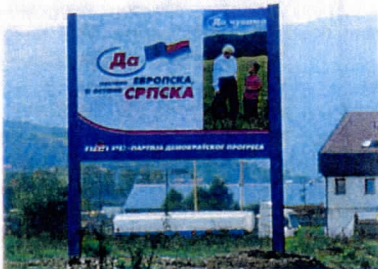
Verkiezingsplakkaat van PDP

De PDP zat dit jaar in tegenstelling tot de SDS in een lastig parket. De Bosnisch Servische politieke concurrenten hebben getracht de PDP en het bolle gezicht van de PDP, Mladen Ivanic, op te laten draaien voor haar regeringsverantwoordelijkheden. De PDP heeft er opmerkelijk genoeg voor gekozen om het Bosnisch Servische boetekleed aan te trekken. De partij heeft aangegeven dat de effectieve regeringsperiode van ruim een jaar vanaf 2000 simpelweg te kort was om daadwerkelijk de economische en politieke hervormingen door te kunnen voeren. Vooruitgang is –inderdaad– iets wat alleen stap voor stap bereikt kan worden, aldus de PDP. De PDP heeft op deze manier geprobeerd de kiezer ervan te overtuigen deze partij nog een kans te geven om de al ingezette hervormingen voort te zetten.