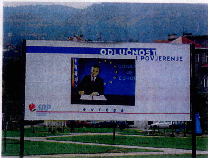
Verkiezingsplakkaat van SDP

(Srpska Demokratska Stranka, Servische Democratische Partij) De SDS heeft zich dit jaar, net als alle andere Bosnische Servische politieke partijen, opgeworpen als dé beschermheer van het Dayton akkoord, met andere woorden het behoud van Republika Srpska. Zoals de SDS heeft aangegeven: de erosie van het Daytonakkoord moet voorkomen worden. Dragan Cavic, de nieuwe president van de RS, heeft Dayton recentelijk verwoord als 'het akkoord dat de enige garantie heeft gegeven voor hetgeen het Servische volk heeft verworven in de Vaderlandse Oorlog'.