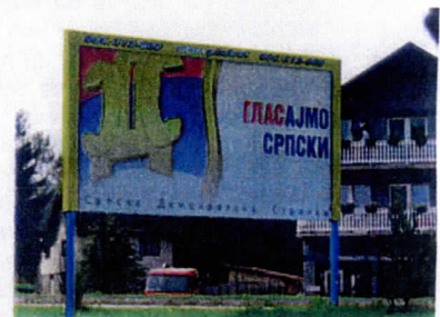
Verkiezingsplakkaat van SDS

De SDS blijft wat dat betreft de voorvechter van het behoud van de RS en kan zich daarbij net als de SDA, als enige beroepen op haar 'roemrijke' burgeroorlogsverleden en zich daarmee onderscheiden van de PDP