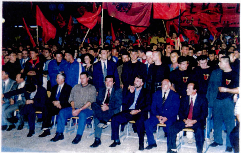
Thaci bijeenkomst