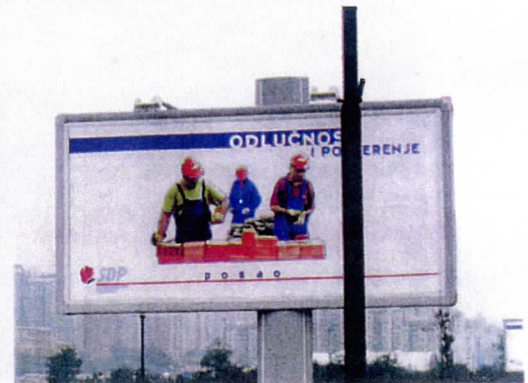
Verkiezingsplakkaat van SDP