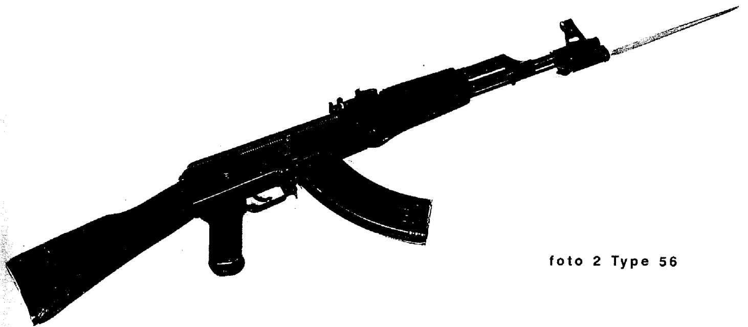
foto 2 Type 56