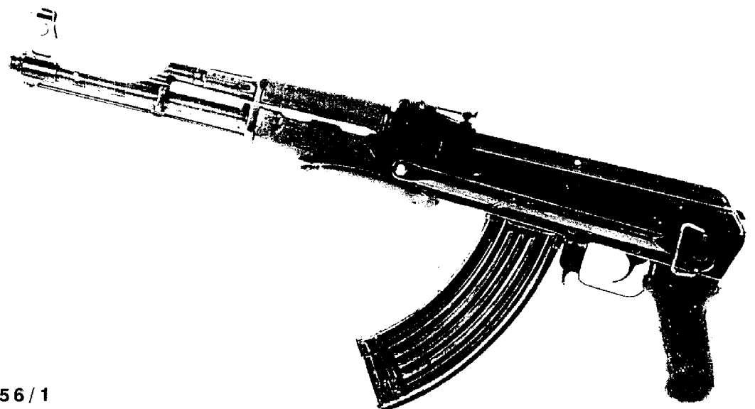
foto 3 Type 56/1