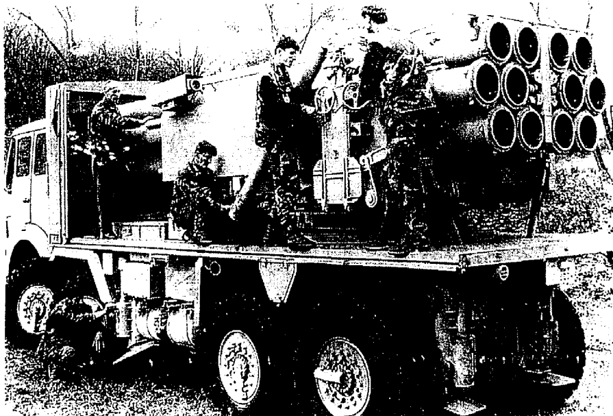
foto 5 ORKAN