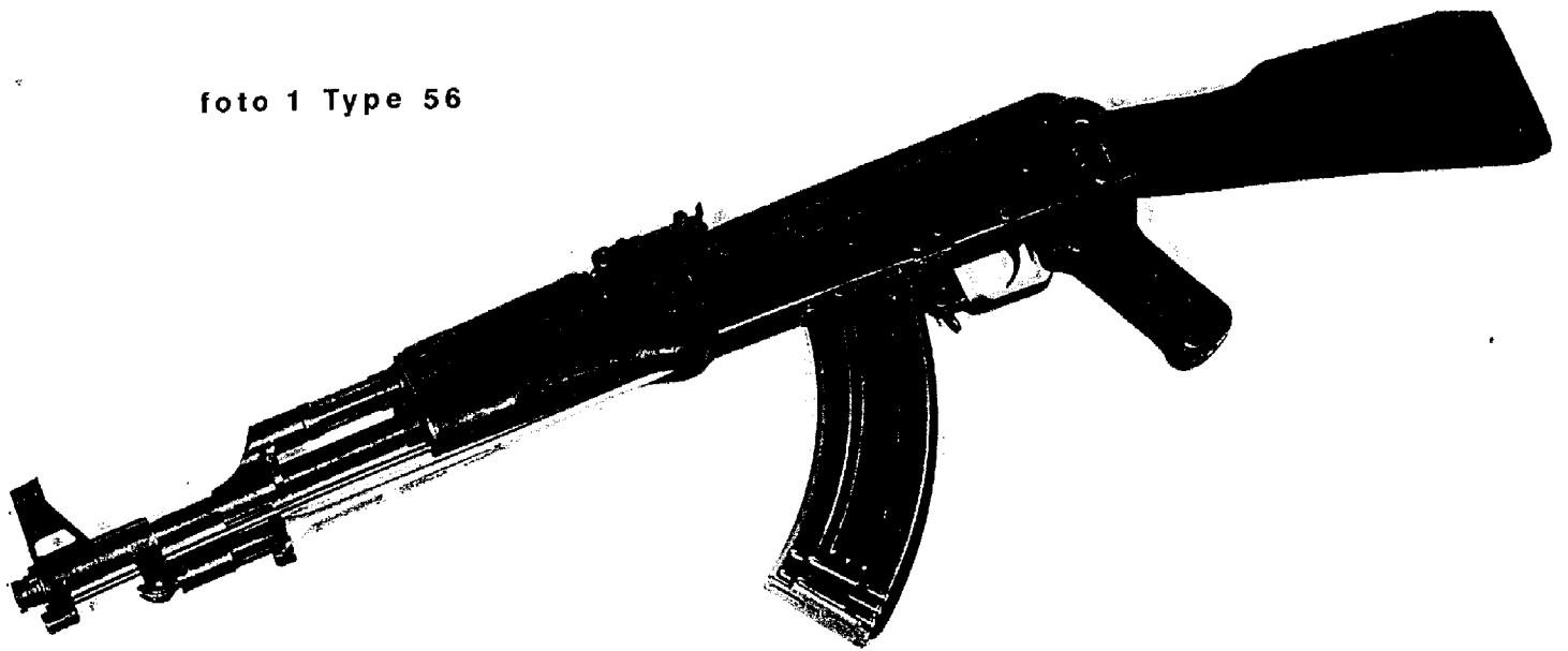
foto 1 Type 56