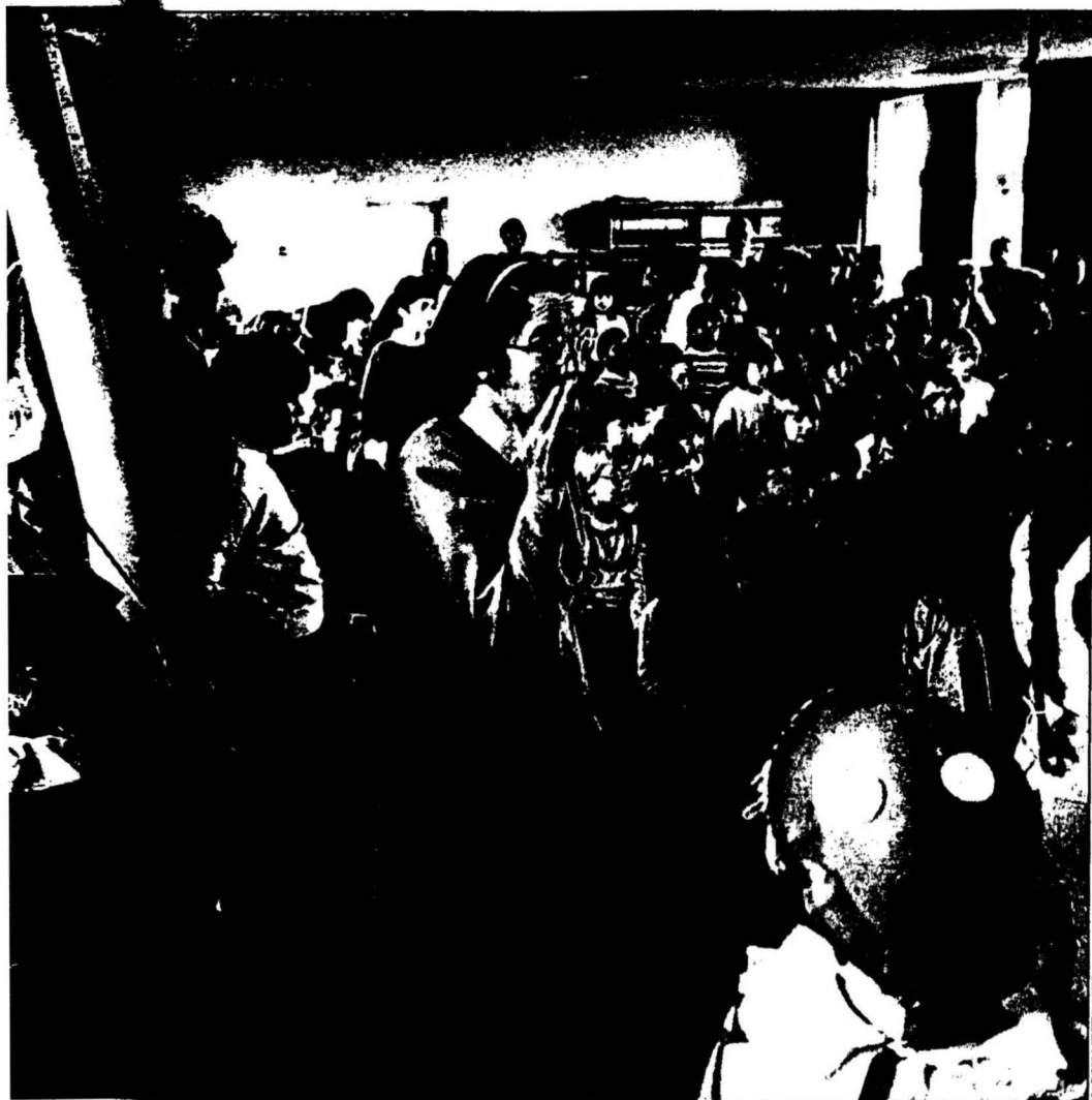
HARRY MEIJER / H&amp;H