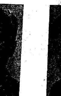
Europa's grote drie: Bevin, Molotof en Bidault.

Spanje, de uitgeworpene De ministers van buitenlandse zaken van Frankrijk, Groot-Brittannië en Rusland zijn gisteren tenzij men gekomen om een gezamenlijk antwoord op te stellen op het programma van minister Marshall betreffende de wederopbouw van Europa met Amerikaanse hulp. De eerste bijeenkomst duurde tot 11 uur. Klokslag 18 uur arriveerde Bevin, de Engelse minister van buitenlandse zaken, aan de Quai d'Orsay, waar hij door Bidault ontvangen werd. Daarna reed de grote auto van Molotof (Sowjet-Unie) voor. Molotof was vergezeld van 6 leden der Sovjet-russische delegatie. Vele fotografen verschenen om een van de belangrijke persoonlijkheidsvereniging in de voorhal van het ministerie, op de gevoelige plaats vast te leggen. Bidault maakte met een grappig excuus voor de warmte, die zijn gasten te Parijs moeten verdragen, en ging hen vervolgens voor naar de „salon des Perreguets” („Papagaaienkamer”), waar de besprekingen onmiddellijk een aanvang namen.