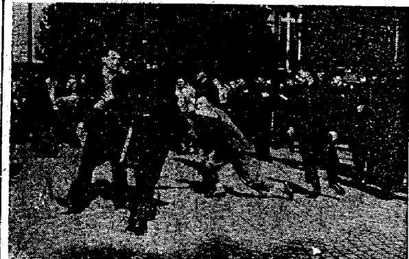
De toestand in Frankrijk blijft gespannen. Dagelijks vinden er onlusten tussen betogers en politie plaats. De ene staking wordt door de andere opgevolgd, daar de arbeiders ontevreden zijn over de nieuwe financiële maatregelen van de regering Ramadier

Op de tweede bijeenkomst van het Franse kabinet is geen overeenkomst bereikt over de loonpolitiek. De socialistische ministers wensen de algemene herziening der lonen, die de M. E. P. en de radicalen zijn bezeten. Waarnemers voorstellen