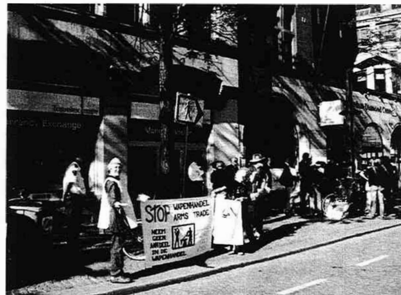
Demonstratie bij conferentie van de wapenindustrie Dam, Amsterdam 3 juni 2010

info@stopwapenhandel.org bank 39.04.07.380 www.stopwapenhandel.org