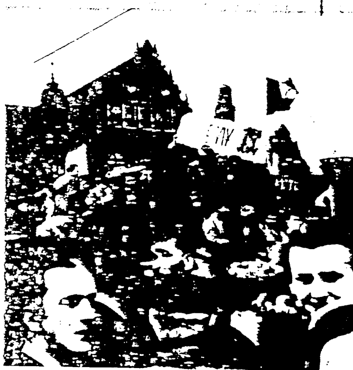
In Poznan en andere steden werden in 1956 door de arbeiders spontaan arbeidersraden gevormd

bestuur' vanwege de slechte ervaringen die men er mee heeft. Arbeidersraden kunnen makkelijk ingekapseld en in hun functioneren beknoot worden. Vakbonden lopen wat dat betreft minder gevaar; hun taak is niet medebesturen maar het behartigen van de belangen van een bepaalde (grote) groep mensen. De overheid zal vakbonden dan ook waarschijnlijk wat minder makkelijk van