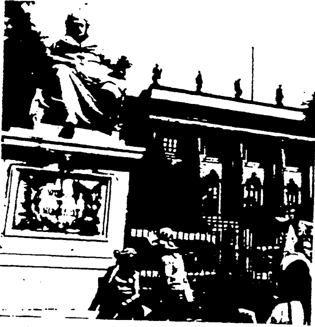
Het gesloten hek van de oostberlijnse Humboldt-universiteit: hogere toelatingseisen voor vrouwen

wel blijkt dat het wel enorm leeft bij vrouwen, maar toch moeilijk zo een twee drie bespreekbaar te maken is. Dergelijke onderwerpen middels een georganiseerde beweging in de openbaarheid te gooien was een nieuwe gedachte voor hen.