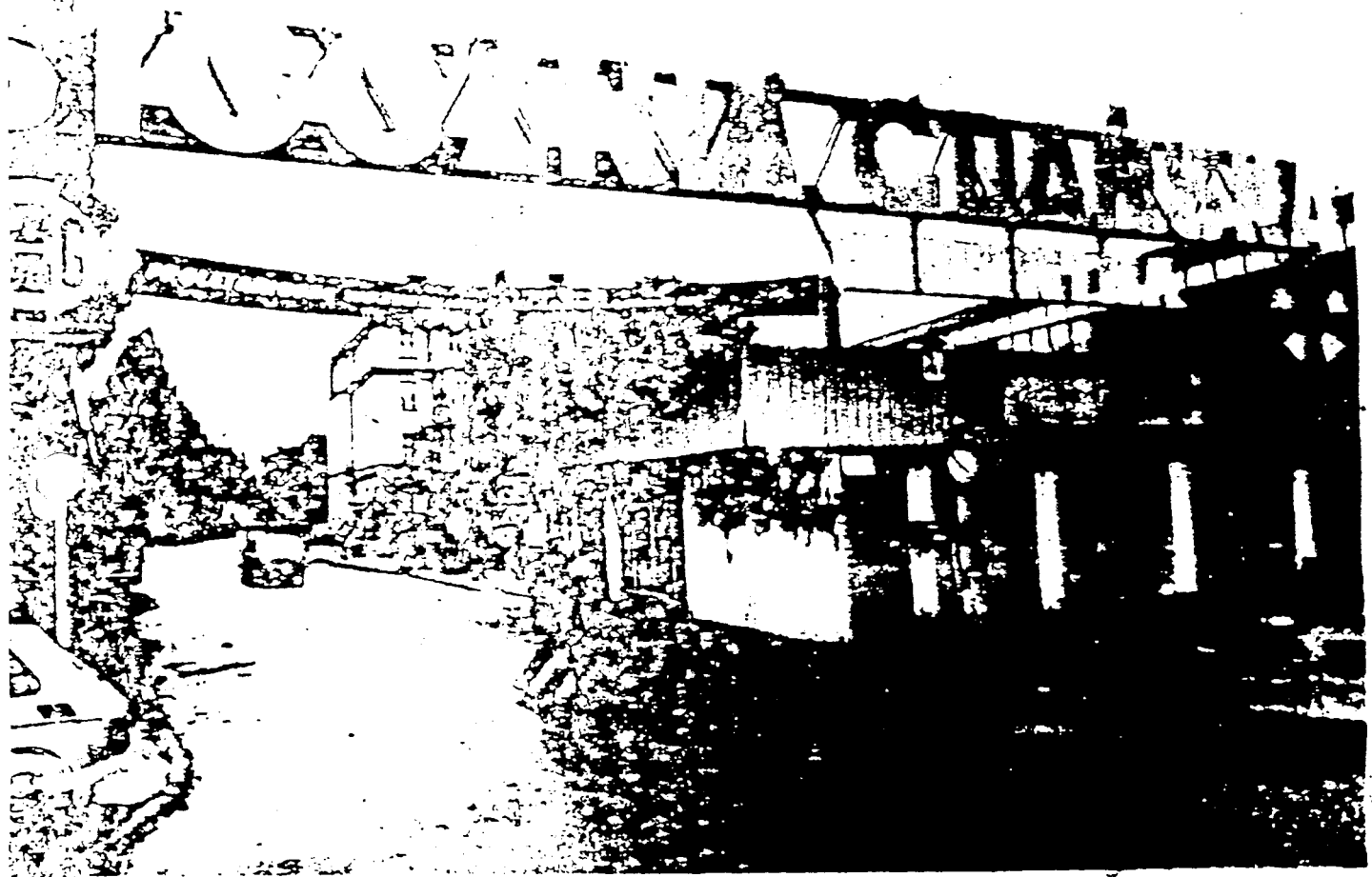
De stakers van de Lenin-werf gaan weer aan het werk nadat de vorige dag het akkoord van Gdansk bereikt is. Onder de poort hangt een spandoek met de tekst: 'Werkers van de fabrieken, verenigt u!'

sen de werknemers en hun getrappt verkozen vertegenwoordigers op bedrijfsstaks- en nationaal nivo een groot probleem. De arbeidersraden boven het nivo van het individuele bedrijf zullen immers wel door de betrokken raden van één nivo lager uit hun eigen midden worden samengesteld.