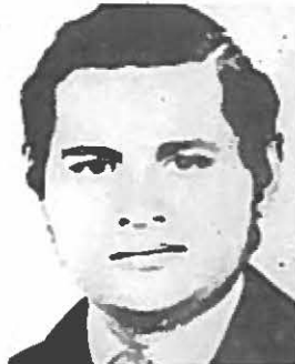
Ramirez Sanchez, Illich gen. "Carlos" 12. 10. 49 Caracas/Venezuela