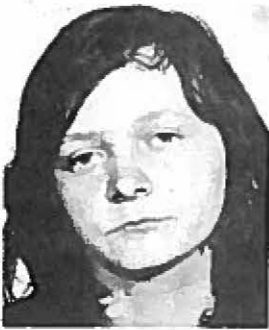
Becker, Verena 31. 7. 52 Berlin Aufnahmejahr 1972