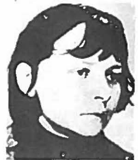
Becker, Verena 31. 7. 52 Berlin