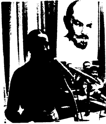
People's Artiste of the USSR, meets her consti- tuents

In de periode, die voorafgaat aan de verkiezingen, komt in de Sovjet-Unie een organisatie van de grond die tot doel heeft de kiezer te mobiliseren. In clubs, cultuurcentra en overheidsgebouwen worden ag. agitpoenkt ingericht, waar ten behoeve van de kiezer het belangrijkste propa- gandamateriaal bijeen wordt gebrac. Vanuit deze centra zijn de ag. agi- tatoren of propagandisten actief, d