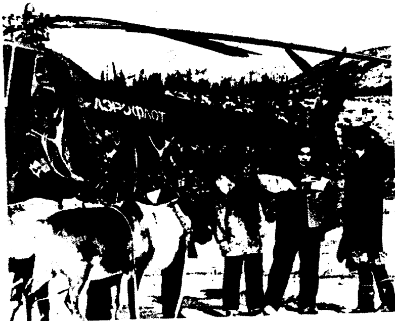
Rendientelers van de sowchoze 'Tsjarski' in een afgelegen noordelijk district van het gebied Tsjita (RSFSR) brengen hun stemmen uit

ieder 10 of 20 woningen hebben te bezoeken. Zo'n propagandist- club de eerder aangehaalde -brochure - "gaat na wie afwezig zal zijn en wie ziek is en verlangt dat er een verzegelde urn aan huis wordt gebracht voor de stemming". Hij doet "zijn rondgang in de kieskring en vertelt over de kandidaat".