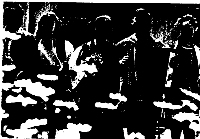
Election day in the USSR is a nation-wide holiday.

twee maanden na de verkiezingen" de nieuwe Opperste Sovjet worden bijeengeroepen.