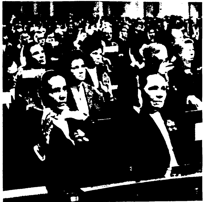
De Opperste Sovjet van de USSR van de tiende samenstelling keurde op zijn vijfde zitting van 23 juni 1981 eensgezind de oproep 'Aan de parlementsleden en volkeren van de wereld' met het oog op het bewaren en verstevigen van de vrede, die gemeengoed is van de hele mensheid goed