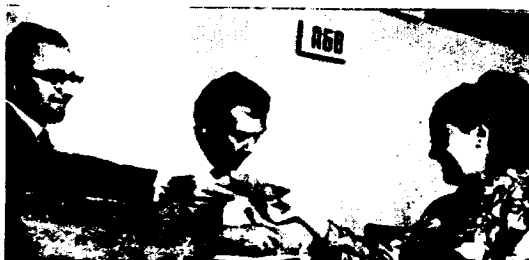
A high percentage of the electorate—about 99.8 per cent—vote in elections in the USSR.

Op 4 maart a.s. zullen in de Sovjet-Unie een dikke 175 miljoen burgers hun gang maken naar de stembus om deel te nemen aan de eens in de vijf jaar te houden verkiezingen voor de Raad van de Unie en de Raad van Nationaliteiten, de twee kamers waaruit het Sovjetrussische parlement - de Opperste Sovjet - is samengesteld.