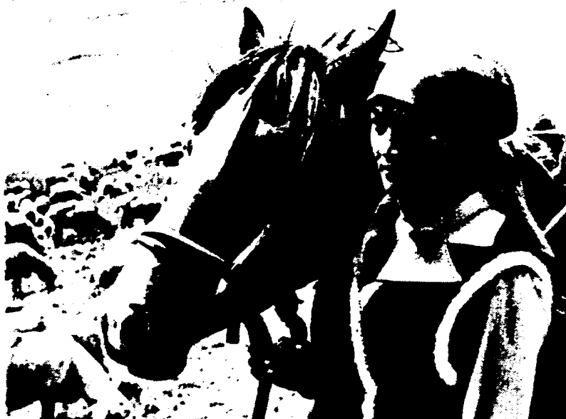
De afgevaardigde van de Opperste Sovjet van de USSR, de leidster van de schapentelers van de experimentele basis voor veeteelt van Tjan-Sjan in Kirgizie

CPSU, maar ook aan vakbondsonderdelen, de Komsomol-jeugdbeweging, maatschappelijke organisaties, arbeidscollectieven en "aan vergaderingen van dienstplichtige militairen per legeronderdeel". Per kiesdistrict wordt door elk onderdeel dat daartoe de bevoegdheid bezit een kandidaat gesteld. Het is overigens mogelijk dat in deze fase "voorgestelde kandidaten" door de vergadering bij "gewone meerderheid van stemmen" worden afgewezen. "In dat geval", aldus de -brochure, "wordt onmiddellijk een andere kandidatuur maar voren geschoven. Elke deelnemer aan de vergadering kan (daarbij) zijn voorstellen doen".