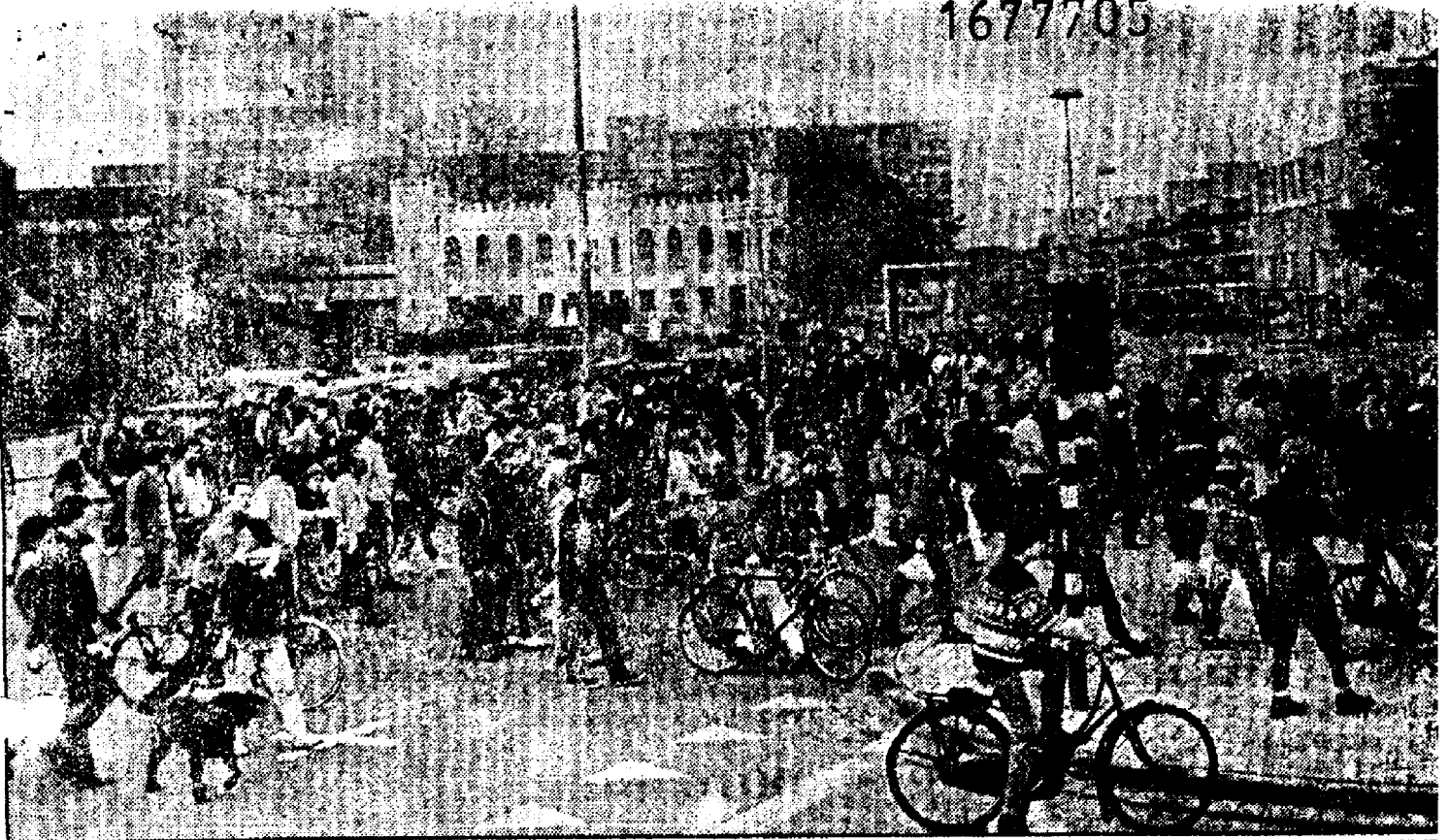
Demonstranten tegen de Centruumpartij op de Schouwburggring in Tilburg.