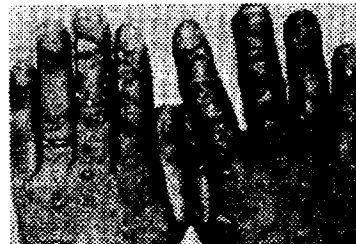
Infectie met tularemie

Dat Irak onderzoek deed naar organismen die potentieel geschikt zijn als biologisch wapen, was al geruime tijd bekend. Het ging daarbij niet alleen om de twee bacteriën waarvan Irak nu toegegeven heeft de militaire bruikbaarheid te testen. In 1985 leverde het Centre for Disease Control in Atlanta drie zendingen van het virus dat verantwoordelijk is voor nijkooorts ("West Nile Fever") aan de Irakezen.