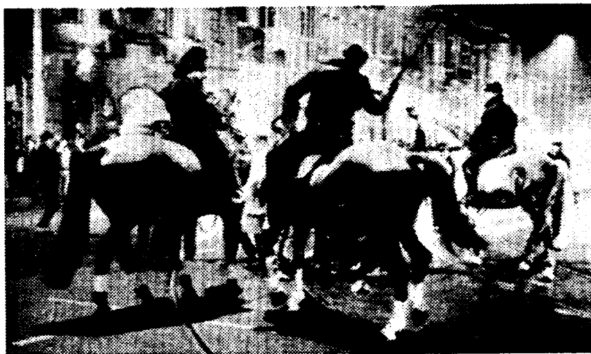
Anti-oorlogsdemonstratie Amsterdam 19 januari

In de editie van "NN" van 24 januari werd de aandacht verplaatst van de militaire transporten naar het militair industrieel complex in het algemeen. Het blad publiceerde onder de in kapitale letters gezette leuze "SABOTEER DE OORLOG", een opsomming van tientallen bedrijven die, volgens het Anti-Militaristies Onderzoeks Kollektief (AMOK), produkten met een militaire toepassing aan Irak hebben geleverd of betrokken zijn bij het transport van militair materieel naar het Golfgebied. Mogelijk naar aanleiding van deze expliciete opwekking voerden acht vermomde activisten enkele dagen later een vernielingsactie uit in het voorlichtingscentrum van het ministerie van Defensie.