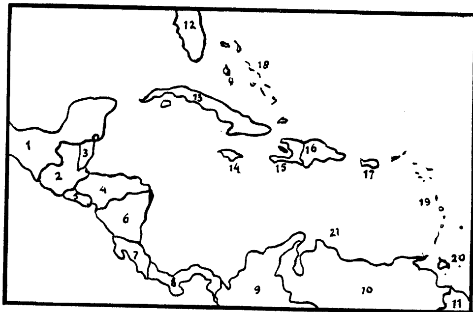
Het Caraïbische gebied

worden wel eens aangeduid als de "bananenrepublieken". Indien dan ook nog het woord "koffie" wordt genoemd, zijn niet alleen de belangrijkste inkomstenbronnen aangegeven, maar zijn tevens de economische zwakten dezer landen gesignaleerd.