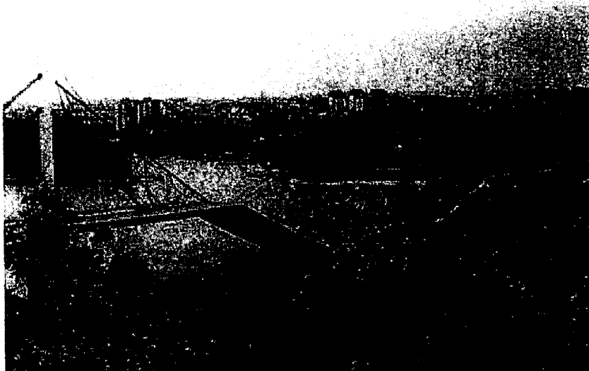
Vernielde brug over de Donau bij Novi Sad in Vojvodina

In de 6 e en 7 e eeuw vestigden de eerste Slavische volkeren zich op dit deel van de Balkan. Drie eeuwen later arriveerden Hongaarse nomaden. De regio viel min of meer onder de controle van de Hongaarse koning in Boedapest, totdat de Ottomanen in de 16 e eeuw de Balkan veroverden. De verovering door de Ottomanen was echter nooit compleet. Feitelijk vormde de rivier de Donau de noordelijke grens van het Turkse rijk. Veel Serviërs trokken na de val van het Middeleeuwse Servische Koninkrijk (eerste migratie) of na de mislukte inval van de Oostenrijkse troepen (1690, tweede migratie) weg uit de Kosovo- en Raska-regio en vestigden zich buiten de Ottomaanse invloedssfeer in het gebied wat nu bekend staat als Vojvodina. Oorlogvoering resulteerde in een ontvolking van de regio. Aan het begin van de 18 e eeuw werd het gebied opgenomen in het Oostenrijk-Hongaarse Rijk, waarna groepen Hongaren, Duitsers en Roemenen er zich vestigden en het bevolkingsaantal weer deden stijgen.