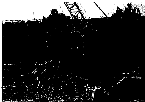
Reparaties aan een verwoeste brug in Vojvodina