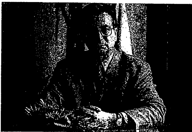
Presidentskandidaat Drazen Budisa

Ten derde zal de regering-Racan het huidige semi-presidentiële stelsel omvormen tot een parlementaire democratie. Naast het afleggen van verantwoording aan de volksvertegenwoordiging door de regering, is hiervoor een drastische inperking van de bevoegdheden van de president noodzakelijk. Volgens de beoogde premier valt 70% van deze hervormingen zonder grondwetswijziging(en) te realiseren. Bovendien verwacht hij dat de (gematigde elementen binnen de) HDZ de