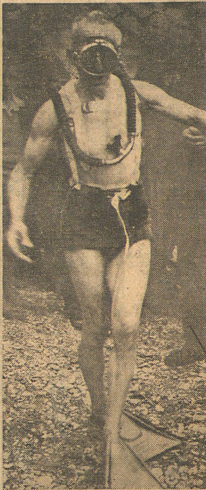
DIT IS EEN „KIKVORSMAN”, voorzien van de speciale uitrusting, die hem in staat stelt geruime tijd op de zeebodem te blijven.

Dank zij een misverstand is de Duitser weer naar zijn land teruggekeerd, maar te verwachten is, dat hij weer op transport zal worden gesteld voor het verdere onderzoek der Nederlandse autoriteiten.