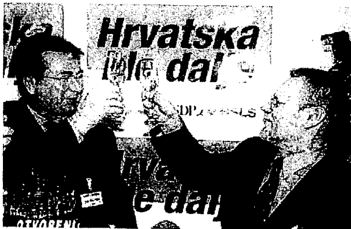
HSLs-leider Drazen Budisa en SDP-leider Ivica Racan klinken op de overwinning

De verkiezingen voor het Kroatische Huis van Afgevaardigden (Zastupnički Dom) eerder deze maand hebben geresulteerd in een politieke aardverschuiving. Op 3 januari maakte het electoraat een einde aan ruim negen jaar alleenheerschappij van de Kroatische Democratische Unie (HDZ), door massaal op de verenigde oppositiepartijen te stemmen. De verkiezingsnederlaag en het feit dat de oppositie de handen ineen heeft geslagen, heeft de HDZ van wijlen president Franjo Tudjman voor het eerst sinds de onafhankelijkheid van Kroatië tot de oppositiebanken veroordeeld. Hoewel de Kroatische Nationale Verkiezingscommissie pas op 19 januari de definitieve verkiezingsuitslag bekend zal maken (zie bijlage en www.izbori.hr/rezultat/rez ), voerde de HDZ al op 10 januari overleg met de oppositie over de machtsoverdracht.