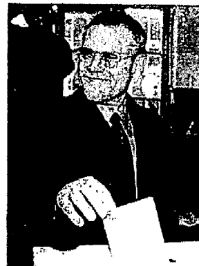
Beoogd premier Ivica Racan brengt stem uit

Het is onwaarschijnlijk dat de SDP-HSLS op de steun van de minderheden zal vertrouwen om zodoende een (minimale) parlementaire meerderheid te garanderen. In overeenstemming met haar verkiezingsprogramma en op basis van eerder gemaakte afspraken, zal de SDP-HSLS in zee gaan met de Porec-groep, waardoor de samenwerkende (voormalige) oppositiepartijen voor een ruime meerderheid voor het beleid van de nieuwe, door Racan geleide regering zullen zorgdragen. Op 11-12 januari voerde de SDP-HSLS reeds besprekingen met de Porec-groep, waarbij duidelijk werd dat de verkiezingsuitslag als verdeelsleutel voor de ministersposten zal worden gehanteerd. Volgens verwachting zal de SDP de helft van de ministers leveren, terwijl de HSLS en de Porec-groep ieder een kwart mogen voordragen. Mocht laatstgenoemde groep gaan dwarsliggen, dan moet rekening worden gehouden met een intensivering van de samenwerking tussen SDP-HSLS en de HSS, de grootste partij binnen de Porec-groep. Bij monde van haar beoogde premier heeft de regering-Racan zich vier doelstellingen gesteld.