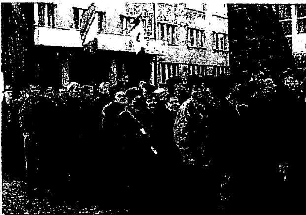
Bosnische Kroaten in de rij voor een stembureau

De vervanging van de HDZ door de SDP-HSLS is hard aangekomen in het Bosnisch-Kroatische kamp. Terecht vreest de HDZ BiH, de zusterpartij van de grote verliezer van de Kroatische verkiezingen, dat de nieuwe pleitbezorgers van de eenheid van Bosnië-Herzegovina de financiële steun vanuit Zagreb (geleidelijk) zullen stoppen. Vast staat dat de nauwe samenwerking tussen het Kroatische leger (HV) en de Bosnisch-Kroatische