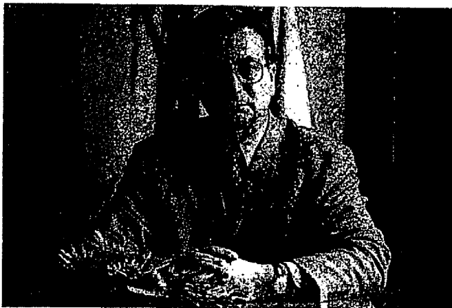
Presidentskandidaat Drazen Budisa

Ten derde zal de regering-Racan het huidige semi-presidentiële stelsel omvormen tot een parlementaire democratie. Naast het afleggen van verantwoording aan de volksvertegenwoordiging door de regering, is hiervoor een drastische inperking van de bevoegdheden van de president noodzakelijk. Volgens de beoogde premier valt 70% van deze hervormingen zonder grondwetswijziging(en) te realiseren. Bovendien verwacht hij dat de (gematigde elementen binnen de) HDZ de