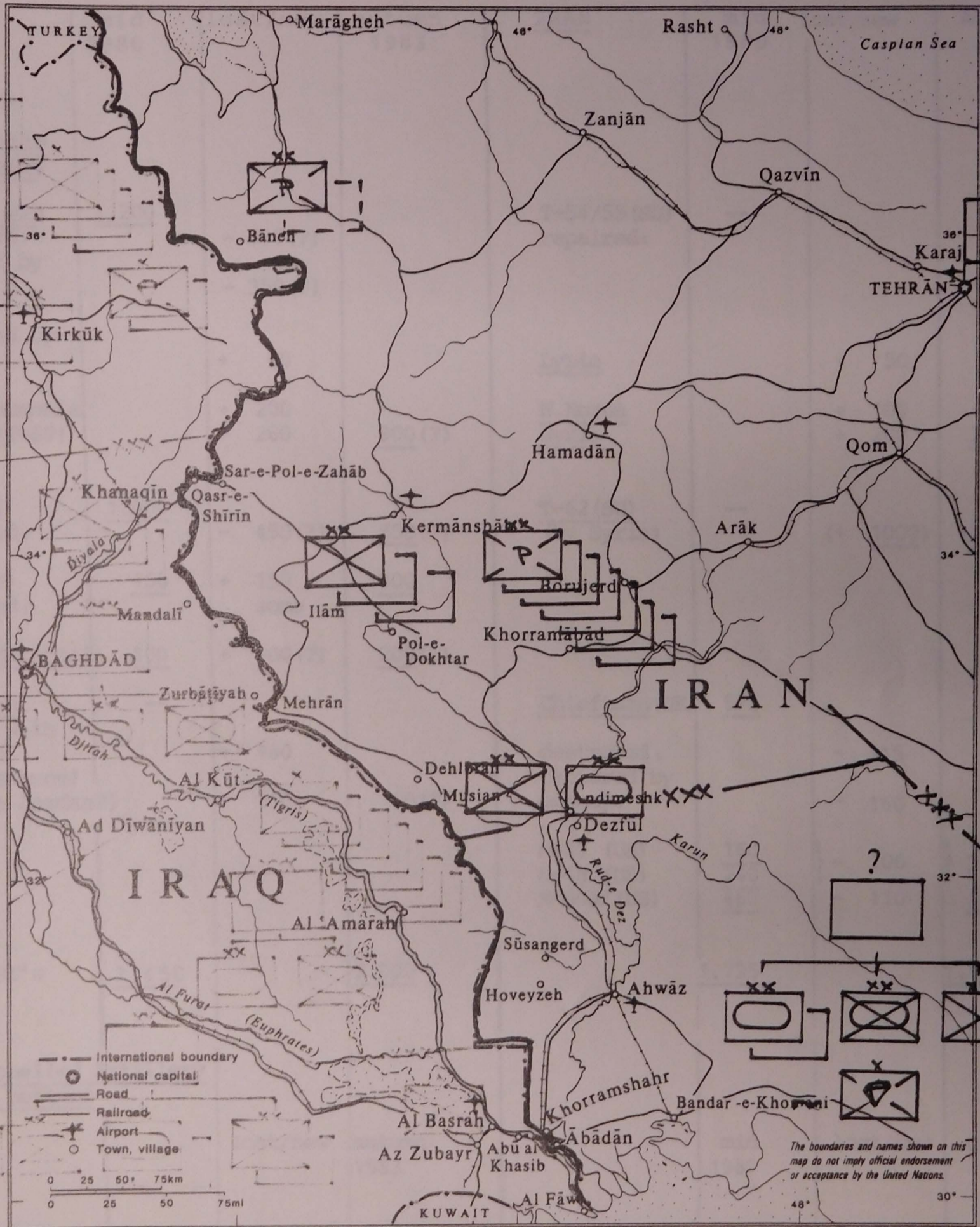
MAP NO. 3246 UNITED NATIONS JUNE 1963