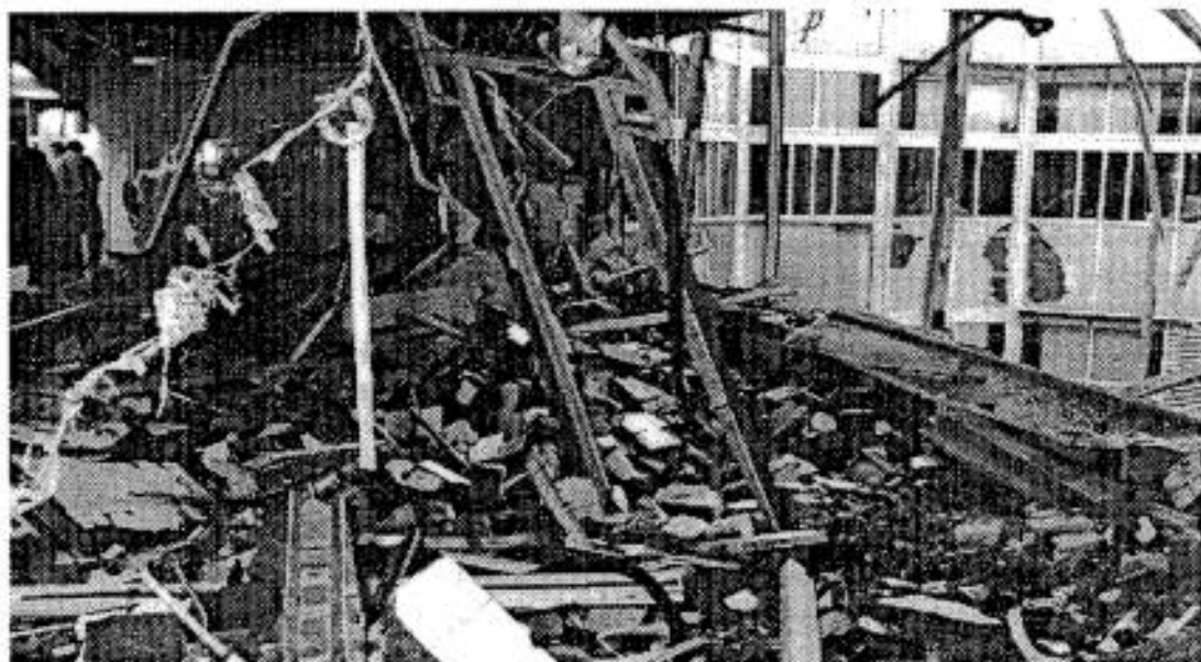
De ravage bij de DIA

Later op de ochtend, rond vijf uur, kwam over de fax van Radio Rijnmond een vier vellen tellende verklaring binnen, waarin de aanslag werd opgeëist door de Revolutionair Anti Racistische Actie (RARA) 50 . In de verklaring stelt RARA het te hebben gemunt op de Dienst Inspectie Arbeidsverhoudingen (DIA) van het departement, omdat die afdeling een spilfunctie vervult in de jacht op illegalen.